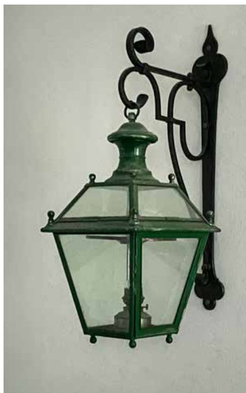
Die letzte originale Lampe hängt heute im Bürgerkeller des Bürgerhauses Langendorf

Lebens nach Einbruch der Dunkelheit beitrug. Historische Strassenbeleuchtung ist heute oft auch ein kulturelles Erbe, das in vielen Städten gepflegt wird.