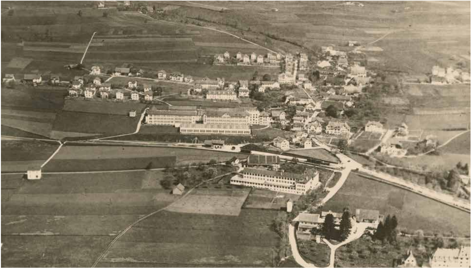
Luftaufnahme von Langendorf im Jahr 1926