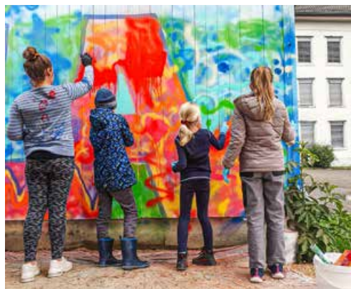
Jugendarbeit Langendorf: Kreative Projekte wie die Gestaltung der Westfassade des Jugendtreffs durch einen professionellen Sprayer zeigen das Potenzial jugendlicher Energie und Initiative.