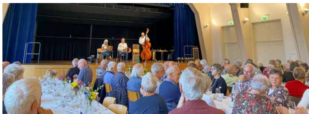
Seniorenanlass im Konzertsaal: Das Trio «Ratatui» sorgt für musikalischen Genuss und einen gemütlichen Austausch.

«Ich bin stolzer Vater von drei wunderbaren Töchtern und lebe seit 15 Jahren mit meiner Familie in Langendorf. Zwar habe ich in der neuen Kommission aufgrund beruflicher Verpflichtungen kein aktives Ressort übernommen, doch ich stehe der Kommission im Hintergrund zur Verfügung und unterstütze tatkräftig. In meiner Freizeit zieht es mich vor allem in die Natur – ob im eigenen Garten oder auf der Skipiste – und ich betätige mich aktiv im STV Langendorf.»